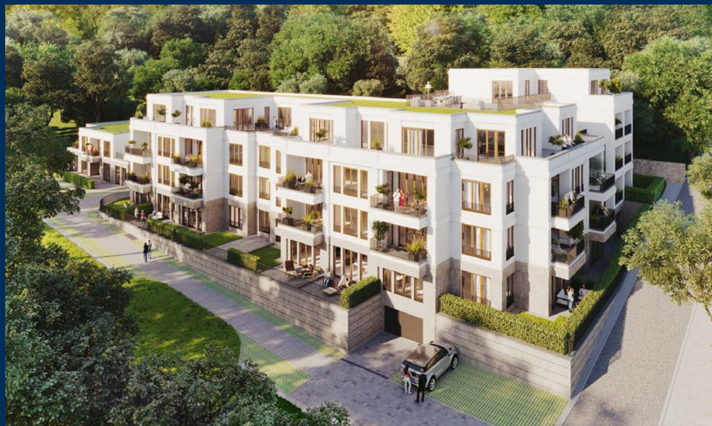
Das Kaiserpalais in Duisburg wird in Kürze übergeben.

Nettoumsatz Umsatzkosten Bruttoumsatzerlöse